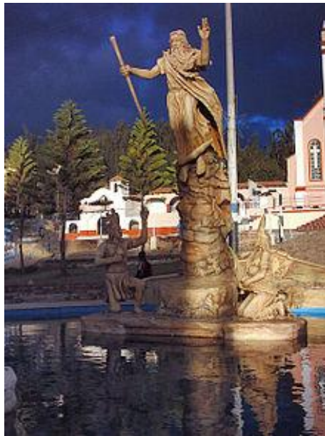
Monumento a Bochica en el municipio de Cuitiva (Boyacá).

Chía (La Luna): su templo estaba en lo que hoy conocemos como el municipio de Chía y era venerada especialmente por los súbditos del zipa , que se consideraban sus descendientes.